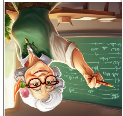
Elfi und Zwölfi