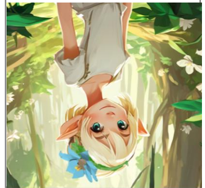
Frau Feuerblume und Drachenherz